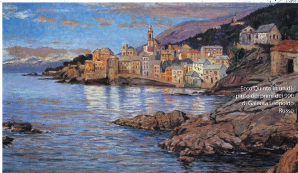
Ecco Quinto in un dipinto dei primi del 900 di Galeota Leopoldo Russo

Rossa, alle pendici del monte Moro, in cui avrebbero abitato i familiari. Si sa, però, quante tesi e ipotesi ci siano su questo tema, il più delle volte contraddittorie. Colombo è rappresentato in un affresco nella chiesa di San Pietro situata sulla via Antica Romana. Durante il periodo napoleonico il borgo conobbe la prima trasformazione in seguito ai lavori per l'apertura dell'Aurelia aumento