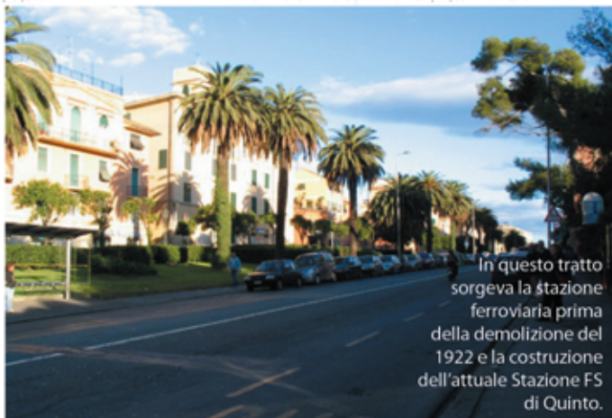
In questo tratto sorgeva la stazione ferroviaria prima della demolizione del 1922 e la costruzione dell'attuale Stazione FS di Quinto.

Il quartiere di Quinto al Mare (poco più di 8.000 abitanti) come lo vediamo e conosciamo oggi, prese forma a partire dagli anni 50 del secolo scorso, quando venne avviata una massiccia espansione edilizia terminata nel decennio successivo con la costruzione di Corso Europa a monte dell'Antica via Romana e della napoleonica Aurelia a mare. Come accaduto per i quartieri di Quarto dei Mille e Sestri Ponente, Quinto deve il nome alla collocazione sulla Via Aurelia antica di epoca romana (ad Quintus Milium - quinto miglio dalla città di Genova). La via romana attraversava Genova perpendicolarmente al torrente Bisagno e al torrente Sturla (i ponti di S. Agata in Borgo Incrociati e quello detto appunto "romano" di via delle Casette a Sturla ne sono testimonianza), era l'asse di accesso alla città da Levante lungo i borghi di Nervi, Quinto, Quarto e Sturla. A prova della sua importanza, in molti testi medievali veniva indicata con l'appellativo di Strada. L'attuale Via Antica Romana di Quinto conserva tratti di quell'antichissimo asse di vitale