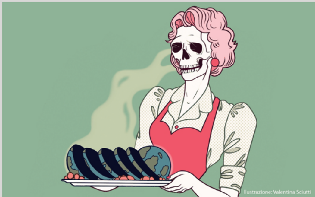
Illustrazione: Valentina Sciutti

Alle nostre orecchie “decrecita” suona come una parolaccia. La nostra civiltà è cresciuta sotto la splendida palma del consumo e della crescita economica, e il segno meno è difficile da digerire come indicazione positiva. Eppure, già negli anni settanta, il professore rumeno Georgescu-Roegen gettava le basi di un nuovo sistema economico in contrapposizione alla crescita del PIL come indicatore positivo. Egli dimostrò quanto la teoria dei consumi potesse facilmente condurre la società occidentale all'entropia, alla paralisi. Nel 1979 i suoi studi vennero pubblicati in Francia attirando l'attenzione degli economisti di tutto il mondo, e si iniziò a parlare di “decrecita” come nuova opportunità, di esaurimento delle risorse non rinnovabili... temi in completo contrasto con il senso comune di quegli anni, che guardava al futuro come a una crescita infinita, fuorviato dall'aumento delle ricchezze e dalla vita comoda. Oggi questo senso comune non dico sia mutato, ma senza ombra di dubbio le crepe del sistema sono visibili a chiunque e l'insofferenza generale inizia ad avvertirsi nitidamente. E affermare che il miglioramento delle condizioni di vita deve essere ottenuto senza aumentare il consumo, non è più