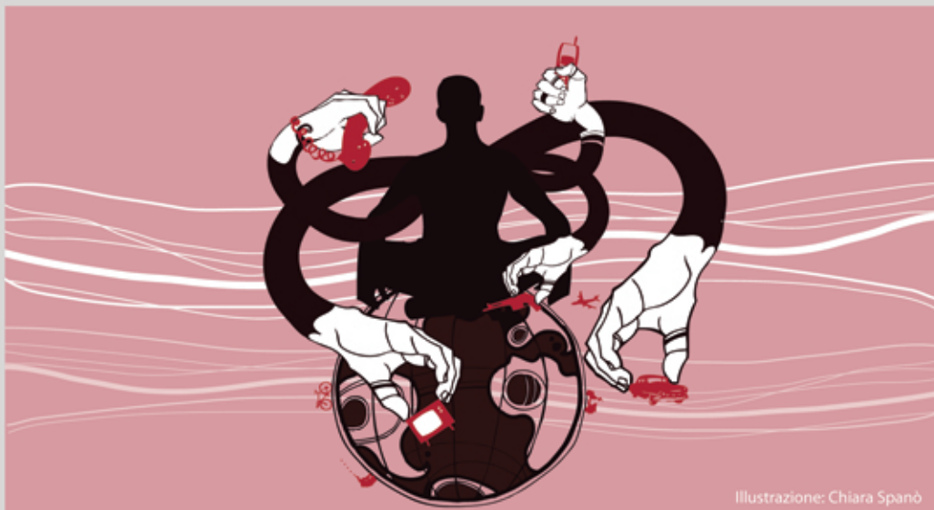
Illustrazione: Chiara Spanò

iniziamo a chiedercelo. Per rifiutare il dogma che la crescita è buona, sempre e per tutti bisogna decolonizzare l'immaginario e uscire dalla cultura che la considera una verità rivelata, quasi religiosa: questa è la provocazione della decrescita serena proposta dal professore francese Serge Latouche. Nel suo ultimo libro, Latouche sfata il mito della torta che lievita all'infinito producendo più fette per tutti; è ora di chiedersi non quanto la torta della crescita potrà lievitare, ma quale sia la lista degli ingredienti: buoni o tossici? Ma se l'economia è una religione, chi pratica la decrescita deve essere il suo ateo, e vivere come se non esistesse! Solo sospendendo la fede acritica nella crescita, potremo percepire la tossicità della torta, e non mangiarla più! I movimenti che si ispirano alla decrescita propongono un'autoriduzione volontaria, serena, della produzione e del consumo all'insegna del meno, ma meglio: non abolire il mercato, ma ricondurlo a semplice spazio sociale dello scambio impersonale; ristabilire un equilibrio tra uomo e ambiente; rilocalizzare la produzione di cibo; riscoprire la qualità della vita. La decrescita è una rivoluzione culturale, da non confondere con l'ambigua retorica della crescita verde, un'opulenza frugale che deriva dalla presa di coscienza che l'aumento dei consumi non può essere l'unico nostro orizzonte, a scapito dell'esistenza del nostro stesso pianeta.