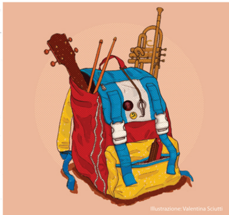
Illustrazione: Valentina Sciutti

del Ministero. Inizialmente abbiamo preso gli insegnanti di ruolo del nostro liceo già impegnati nella sperimentazione, poi abbiamo indetto due bandi di concorso provinciale. I requisiti per l'insegnamento sono una pregressa esperienza in classi musicali sperimentali e il diploma di conservatorio. Infine a settembre abbiamo firmato una convenzione con il Conservatorio Paganini.