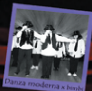
Danza moderna x bimbi