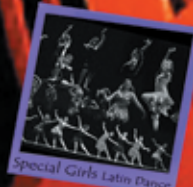
Special Girls Latin Dance