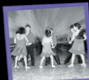
Caraibico x bimbi/adulti