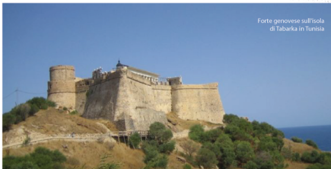
Forte genovese sull'isola di Tabarka in Tunisia

da Pegli lo stesso anno, e nessuno di loro fece più ritorno in patria. Dopo più di un secolo di colonizzazione, nel 1738, un folto gruppo di genovesi tabarkini (per lo più figli di coloni, ma anche nuovi emigranti pegliesi che raggiunsero l'isola a più riprese) si trasferì in Sardegna a causa dell'esaurimento dei banchi corallini e del deterioramento dei rapporti con le popolazioni arabe. Fu Carlo Emanuele III regnante di Sardegna a invitare i coloni a stabilirsi sull'isola di San Pietro, allora disabitata, per fondare un nuovo comune: Carloforte (il nome fu scelto in onore del sovrano). A Tabarca rimasero pochi coloni e nel 1741 il Bey di Tunisi invase l'isola e fece prigionieri gli abitanti genovesi riducendoli a schiavi. La notizia in poco tempo raggiunse le corti di tutta Europa e la liberazione degli schiavi avvenne poco dopo grazie