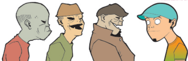
illustrazione di Chiara Spanò