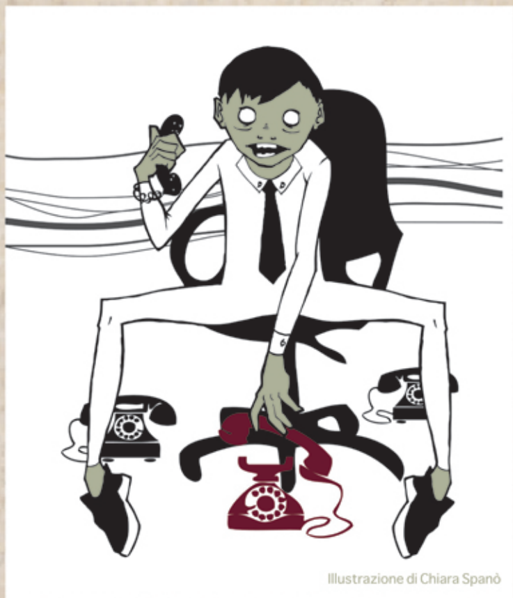
Illustrazione di Chiara Spanò

Perché è virtuale, irreal! Il prodotto dell'industria, sebbene prodotto in serie e con dinamiche ossessive, era prodotto; tangibile, visibile, mangiabile. Oggi invece tutto è servizio, e pertanto etereo, impalpabile e non necessario: anche l'abbigliamento ormai conserva solo un vago ricordo dell'industria da cui è stato prodotto. La borsa firmata Louis Vuitton è, per chi la possiede, solo "LA Louis Vuitton". Questo credo sia più di un banale caso di abbreviazione spicciola nel linguaggio