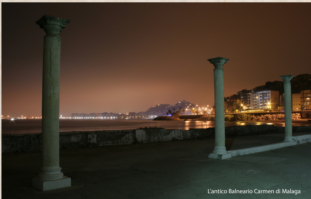
L'antico Balneario Carmen di Malaga

Fondata dai Fenici nel VIII secolo a.C., situata nella costa meridionale dell'Andalusia, Malaga è la sesta città spagnola per numero di abitanti. Ad una prima occhiata ricorda Palermo, temperature alte, sole tutto l'anno (capitale della Costa del Sol), mare... quindi ritmi lenti, orari allungati, irrinunciabile siesta pomeridiana, gente solare, tranquilla e disponibile. Calle Larios è l'arteria principale che conduce a placa de la Constitucion e poi nel centro storico fra vicoli stretti, ristoranti tipici e odor di pescato. Risalendo i vicoli, fra case diroccate (mai toccate dopo le distruzioni della